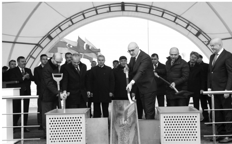
İnşa ediləcək zavodun investisiya da 34%-ni özəl investisiyalar, 66%-ni dəyəri 59,3 milyon manatdır ki, bunun işə kredit vəsaitləri təşkil edir. Tikin-

Müəssisədə Türkiyənin qabaqcıl texnologiyalarının tətbiqi ilə 42 adda yüksək keyfiyyətli müxtəlif doz və qarışıqlarda dərman məhsulları istehsal olunacaq.